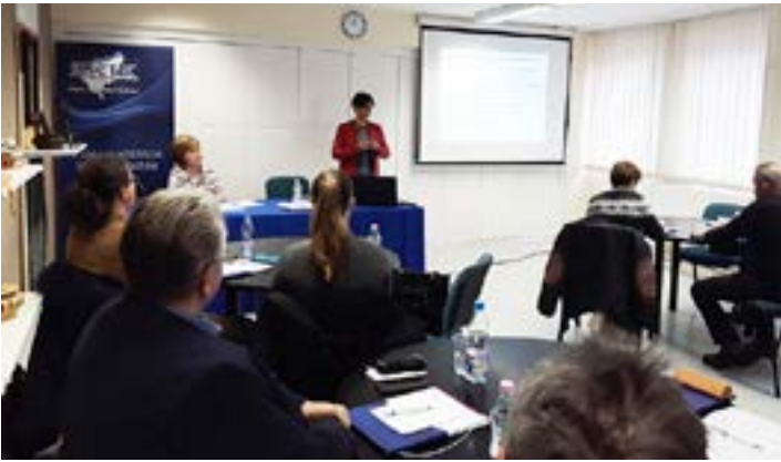
Az év elején szakképzési fórumot tartottunk a gyakorlati képzőhelyek részére