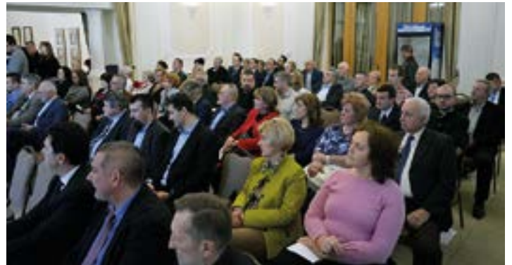
Március 5-én került sorra a hagyományos kamarai Gazdasági Évnyitó, melynek keretében tájékoztatók hangzottak el a hazánkban és az EU-ban várható gazdasági folyamatokról