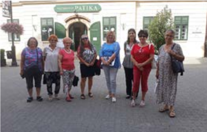
...és a Női Vállalkozók Klubjában.