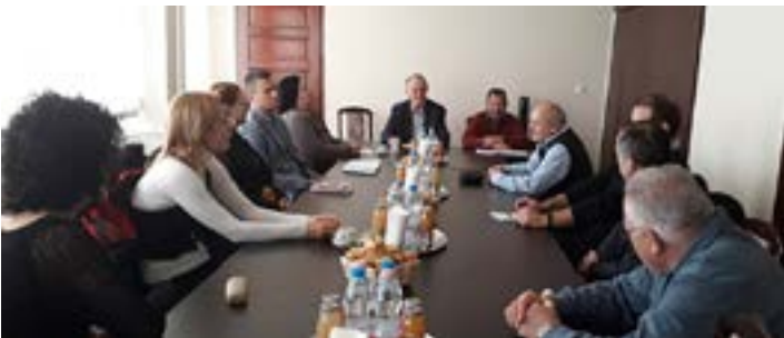
Január 8-án tartotta alakuló ülését a részben megújult személyi összetételű Békéltető Testület