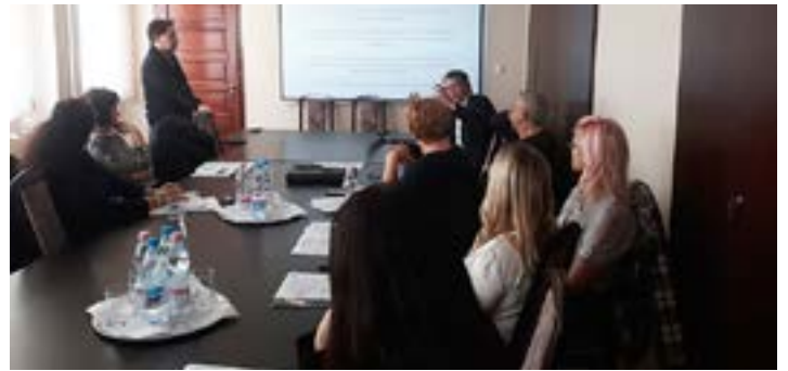
Amikor a vírushelyzet megengedte, aktív élet folyt szakmai Klubjainkban: A Humán Erőforrás Szakmai Klubban...