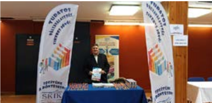
Január 14-én az Eötvösben kamaránk képviseltette magát a hagyományos pályaaorientációs Karriernapon