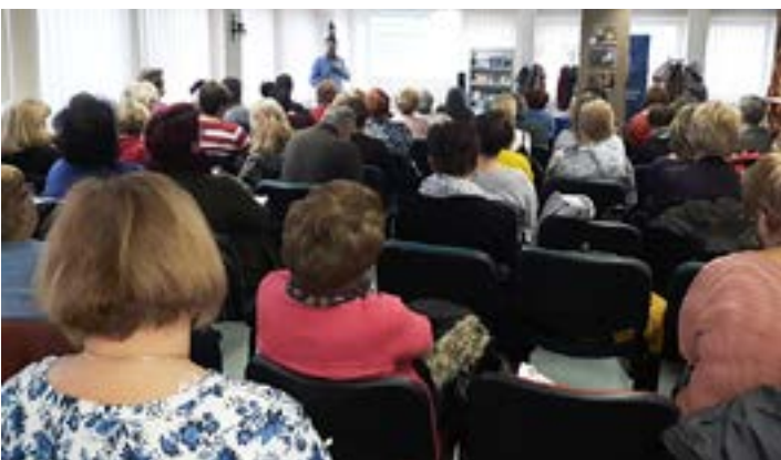
Január 14-én a társasági adótörvény és a társadalombiztosítási szabályok változásairól tartottak előadást nagyszámú érdeklődő részére.