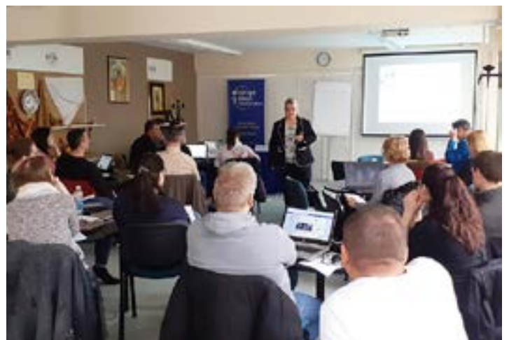
..az Informatikai Szakmai Klubban...