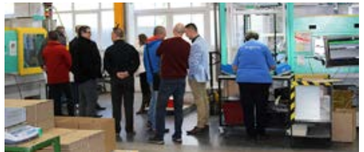
...a Minőségügyi Szakmai Klubban,...